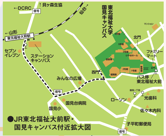
●JR東北福祉大前駅・国見キャンパス付近拡大図