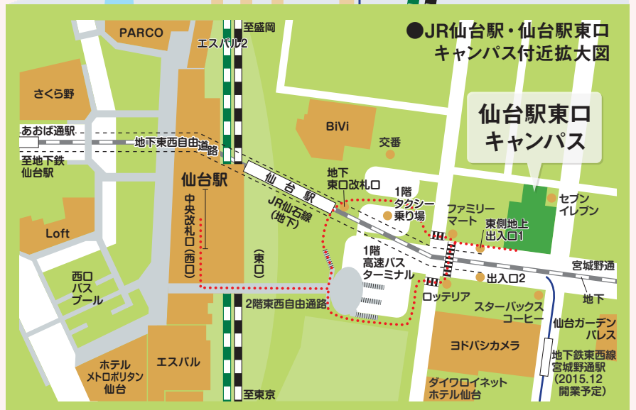
●JR仙台駅・仙台駅東口キャンパス付近拡大図