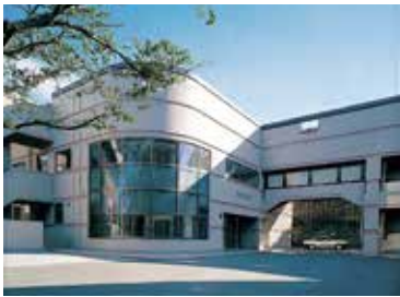
近代的外観を誇るH-One館

この年、全体の景気動向は昨春に政府が打ち出した内需振興策が功を奏し、上昇気流に乗り出した。企業側の求人対前年比18%増と予想され、八七年度卒業生の三分