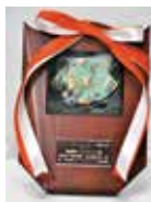
「ジャパソ・レジリエンス・アワード(強化大賞)2015」の表彰式が3月15日、仙台市民会館で開催され、本学第一キャンパスに設けられたエネルギーセンターのコージェネレーション・システムの取組が、全国の208件から最優秀賞19の中に選ばれた。

同17年本学の特任助教授、同19 年特任准教授、同23年から特任教 授に就任、同14年から新潟県同窓 会会長を務めていた。